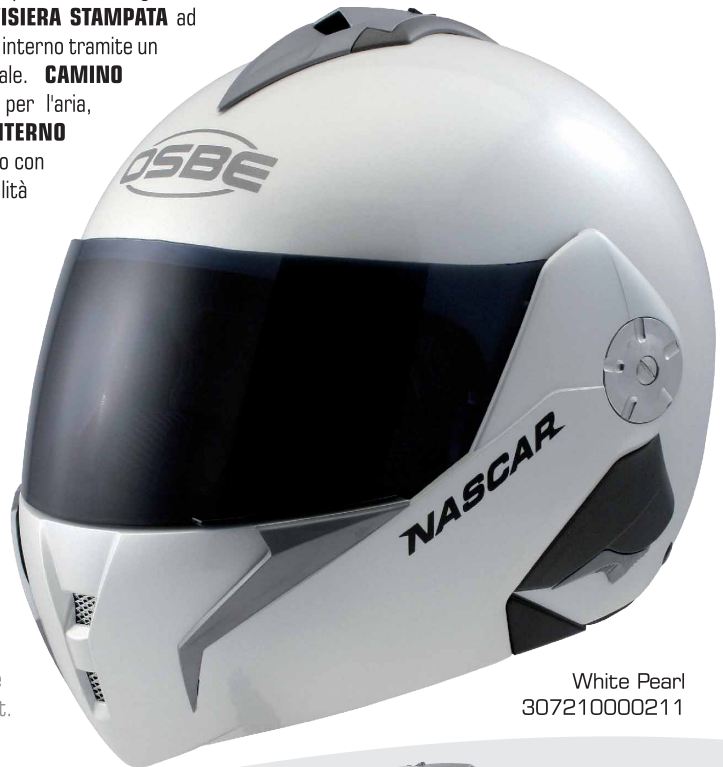
White Pearl 307210000211

HTR SHELL (High Thermoplastic Resin) for a superior strokes-absorbent and a limited weight. DESIGN fashionable and innovative to achieve a perfect aerodynamic profile, a better dynamic stability and a strong inner ventilation. DOUBLE INSIDE VISOR exclusive DSS (Double Screen System-OSBE patent) a dark visor inside the helmet easy to action to prevent sudden strong light dangers and the use of uncomfortable sunglasses under the helmet. NEW BUTTON to action DSS system. INJECTED VISOR. FLIP UP chin part to be opened with just one button positioned in the inside and centre of the chin part, protected from any accidental opening. UPPER SPOILER along with a correctly designed air-intake inside the EPS in order to guarantee the air flow inside the helmet. LINING removable, washable and traspiring, with removable cheek parts, designed with different density sections of material to ensure an excellent fit while putting it on and high level of comfort. MICROMETRIC buckle.