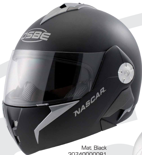
Mat Black 30740000081