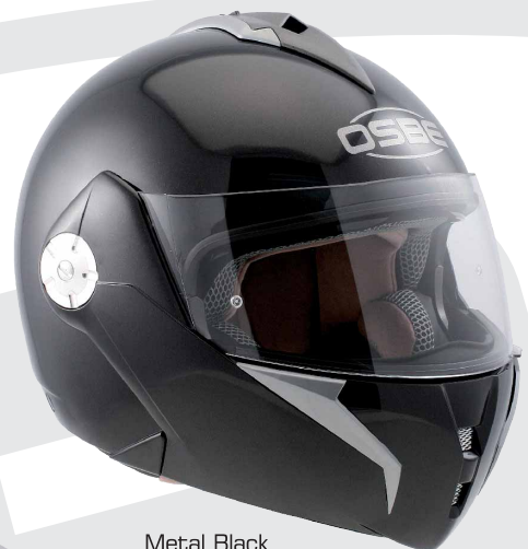
Metal Black 30740000051