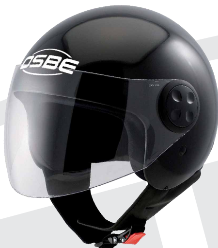
Metal Black 33780000051