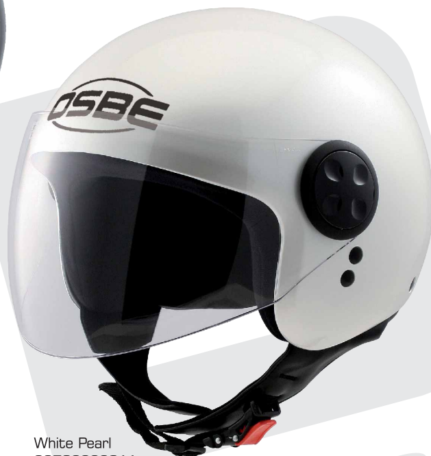
White Pearl 33780000211