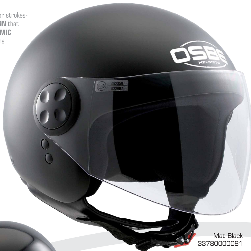
Mat Black 33780000081