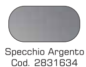
Specchio Argento Cod. 2831634